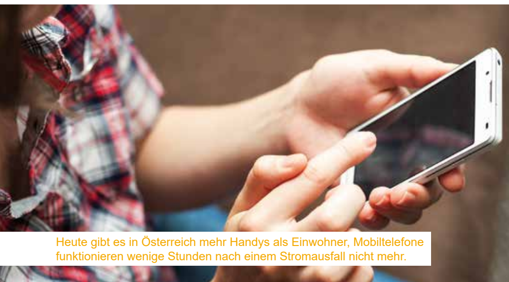
Heute gibt es in Österreich mehr Handys als Einwohner, Mobiltelefone funktionieren wenige Stunden nach einem Stromausfall nicht mehr.

Nachdem ein Blackout für uns unvorstellbar ist, ist es auch schwer vorhersehbar, wie wir auf die totale Dunkelheit und Ungewissheit bzw. auf das, dass auf einmal überhaupt nichts mehr funktioniert, reagieren werden. Vor allem die persönliche Ungewissheit, was mit den anderen Familienmitgliedern ist bzw. wo sie sich befinden, wenn kein Handy mehr geht, kann eine hohe Stressbelastung auslösen. Nichtsdestotrotz gehen wissenschaftliche Untersuchungen davon aus, dass die Bevölkerung in kollektiven Ausnahmezuständen in der Regel sozial, rational und aktiv handelt – ganz wider dem Klischee aus Film und Fernsehen. Die Kooperation und Selbstorganisation auf lokaler Ebene ist ganz entscheidend, wenn die gewohnte organisierte Hilfe nicht mehr wie gewohnt funktioniert. Und je besser man sich mit diesem Szenario auseinandergesetzt hat, desto leichter wird dies auch gelingen.