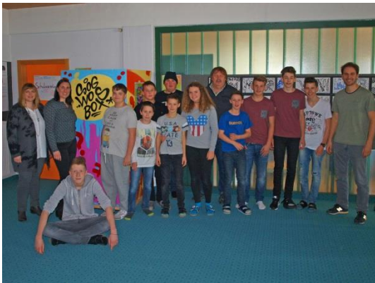
Die Sog wos Box

Der Bedarf eines Jugendtreffs in der Gemeinde ergab sich durch ein breit angelegtes Jugendbeteiligungsprojekt im Jahr 2016/17. Mittels zahlreicher Beteiligungsmethoden- die „Sog wos Box“, der Jugendbus, eine Jugend- und Stakeholder Befragung- wurden die Bedürfnisse und Wünsche der Jugendlichen erhoben und diskutiert. Die Ergebnisse sprachen eine klare Sprache, es braucht in der Gemeinde mehr Freiräume bzw. Jugendtreffpunkte. Die Gemeinde reagierte daraufhin sehr schnell und beauftragte WIKI als Hauptpartner und die Caritas mit dem Aufbau eines Jugendtreffs.