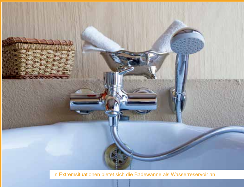
In Extremsituationen bietet sich die Badewanne als Wasserreservoir an.

Wenn man, zum Beispiel bei einem längeren Stromausfall, keine Möglichkeit vorfindet das Wasser abzukochen, dann gibt es auch die Möglichkeit das Wasser mittels Sonneneinstrahlung zu desinfizieren. Das sogenannte SODIS-Verfahren (Solar Water Disinfection) wird als effektive Maßnahme zur Trinkwasserherstellung auch von der WHO empfohlen und vor allem in Entwicklungsländern angewendet. Man benötigt dazu nur eine Glasflasche oder PET-Plastikflasche, die im Idealfall 0,5 Liter und höchstens 2,5 Liter fasst und lässt diese in der prallen Sonne für rund 6 Stunden waagrecht