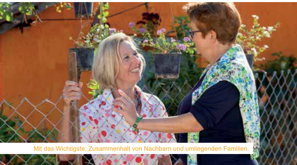
Mit das Wichtigste: Zusammenhalt von Nachbarn und umliegenden Familien.

zum Kochen eignet sich, wie in den voran gegangenen Kapiteln beschrieben, eine rechtzeitig gefüllte Badewanne als Wasserreservoir. Das ist zum Beispiel im Fall eines Reaktorunfalles, wie in Tschernobyl wichtig, da nach einem möglichen radioaktiven Niederschlag auch das Trinkwasser aus der Wasserleitung für einige Tage die Grenzwerte überschreiten kann. Empfohlen wird auch eine Schachtel Micropur Tabletten für jeden Haushalt - für weniger als 20 Euro kann man damit 100 Liter Wasser entkeimen bzw. haltbar machen.