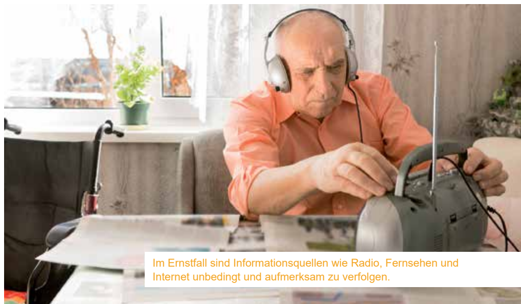
Im Ernstfall sind Informationsquellen wie Radio, Fernsehen und Internet unbedingt und aufmerksam zu verfolgen.

Zudem ist darauf zu achten, dass man für alle Jahreszeiten gerüstet ist, man weiß nicht, wann man auf seine Vorräte zurückgreifen muss. Auch wenn es