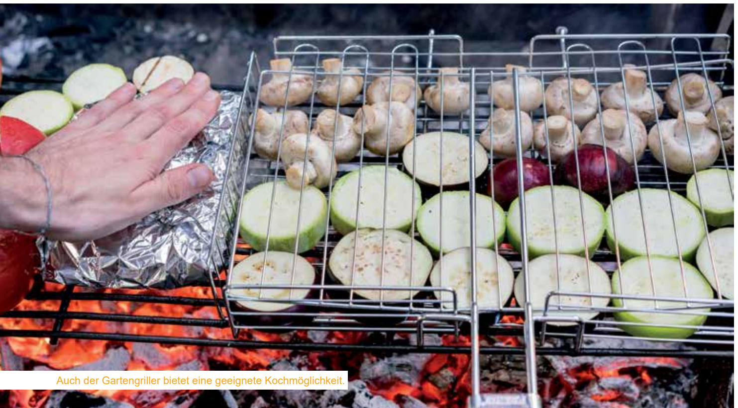
Auch der Gartengriller bietet eine geeignete Kochmöglichkeit.