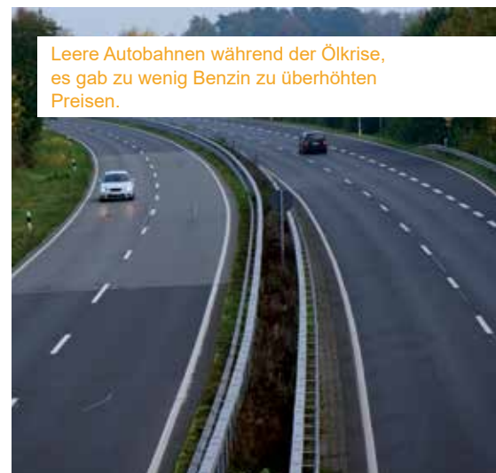
Leere Autobahnen während der Ölkrise, es gab zu wenig Benzin zu überhöhten Preisen.

Plünderungen von Lebensmittelgeschäften. Jene Geschäfte, die noch geöffnet hatten, hatten ihre Waren zu überhöhten Preisen angeboten. Ein weiteres Beispiel war die Zeit unmittelbar nach dem 2. Weltkrieg. Da es vor allem an Lebensmitteln in der Stadt mangelte, kam es nicht nur zu Hamsterkäufen, sondern auch zu Fluchtbewegungen aus der Stadt in den ländlichen Raum. So wurden von manchen Menschen Medikamente und Lebensmittel in riesigen Mengen gehortet, während es andernorts am Notwendigsten fehlte. All diese Beispiele zeigen uns, dass Hamsterkäufe ein massenpsychologisches Phänomen sind, die negative Entwicklungen zusätzlich beschleunigen können. Nur rechtzeitige und wohl überlegte Vorbereitung garantiert im Fall der Fälle Unabhängigkeit.