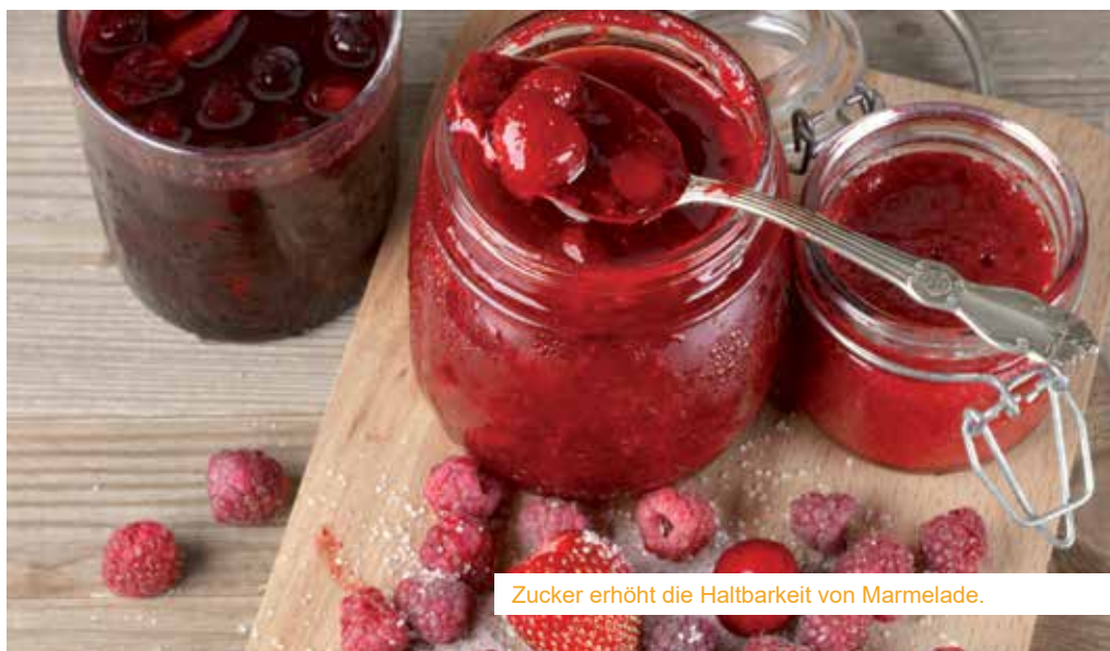
Zucker erhöht die Haltbarkeit von Marmelade.

terium befinden. Generell sollten Konserven bei 12-18 Grad gelagert werden. Linsen, Bohnen, Erbsen und Kichererbsen gehören zu lang haltbaren Hülsenfrüchten (über 1 Jahr). Aber Achtung: Ungeschälte Hülsenfrüchte müssen noch 7-8 Stunden eingeweicht werden, damit sie gar werden. Zahlreiche Früchte gibt es auch in Konserven zu kaufen. Nüsse sind wichtige Energielieferanten. Je nach Sorte und Lagerung sind diese monatelang haltbar. Sollten sie abweichend schmecken, die Oberfläche von Schimmel oder schwarzen Stellen befallen sein, sollte man diese entsorgen, da gefährliche Schimmelpilzgifte vorhanden sein können. Öle in Dosen sind länger haltbar als in Glas- oder Plastikbehälter. Wenn das Öl nicht ranzig schmeckt, dann kann man es bedenkenlos verwenden. Lein-, Traubenkern-, Kürbiskern- und Walnussöl enthalten viele ungesättigte Fettsäuren und sind ca. sechs Monate haltbar, Sonnenblumen und Rapsöl hingegen ein Jahr. Rindfleisch ist bei einer Lagerung von 2° C drei bis vier Tage im Kühlschrank