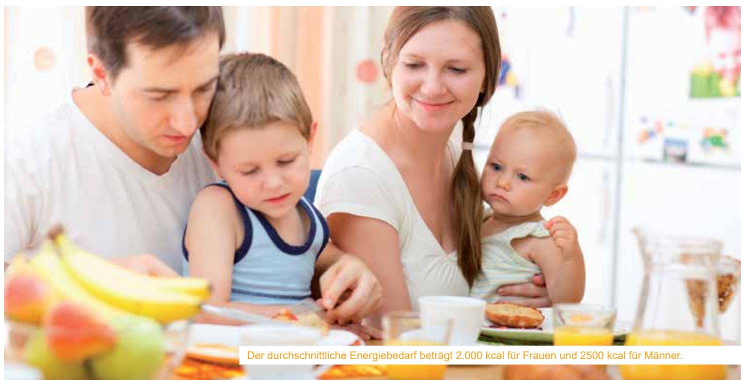
Der durchschnittliche Energiebedarf beträgt 2.000 kcal für Frauen und 2500 kcal für Männer.

Der Energiebedarf muss über die Nahrung abgedeckt werden. Unsere Nahrung entstammt hauptsächlich der Tier- und Pflanzenwelt und beinhaltet größtenteils Eiweiß, verschiedene Fette und Kohlenhydrate. Kohlenhydrate sind reine Energielieferanten und sollten rund 50 Prozent der gesamten Energiezufuhr ausmachen. Zu finden sind diese beispielsweise in Getreide, Getreideprodukten, Kartoffeln, Zucker und Obst. Die un-