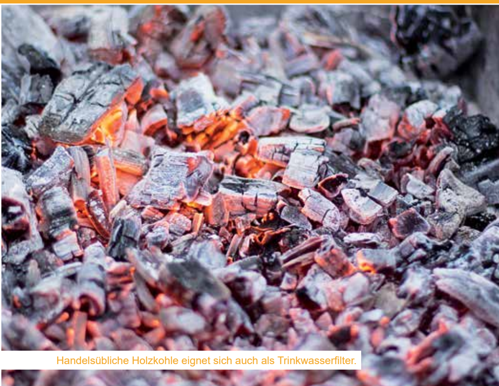
Handelsübliche Holzkohle eignet sich auch als Trinkwasserfilter.

Wie wichtig sauberes Wasser zum Trinken und zur Hygiene ist, zeigen die drohenden zumeist bakteriellen Infektionskrankheiten wie Cholera, Ruhr oder Typhus. Sie haben Durchfall, Bauchschmerzen, Fieber oder Krämpfe zur Folge und können unbehandelt zum Tod führen.