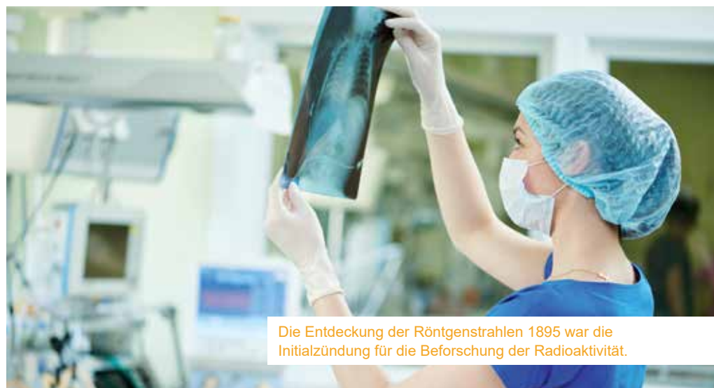
Die Entdeckung der Röntgenstrahlen 1895 war die Initialzündung für die Beforschung der Radioaktivität.

Das erste weitgehend anerkannte Atommodell stammte von Niels Bohr und wurde 1913 entwickelt. Atome bestehen in diesem Modell aus einem schweren, positiv geladenen Atomkern und leicht-