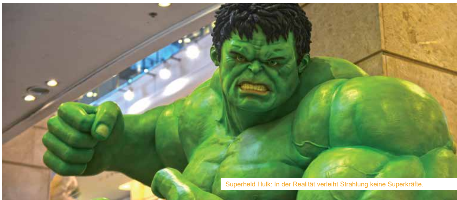
Superheld Hulk: In der Realität verleiht Strahlung keine Superkräfte.