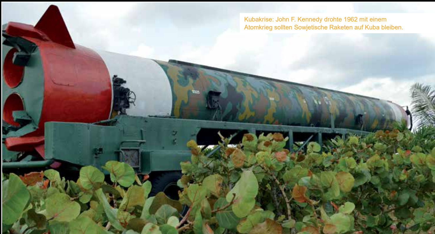
Kubakrise: John F. Kennedy drohte 1962 mit einem Atomkrieg sollten Sowjetische Raketen auf Kuba bleiben.

▲ Laut Experten ist heute das theoretische Wissen, das man zum Bau einer Atombombe benötigt, weit verbreitet.