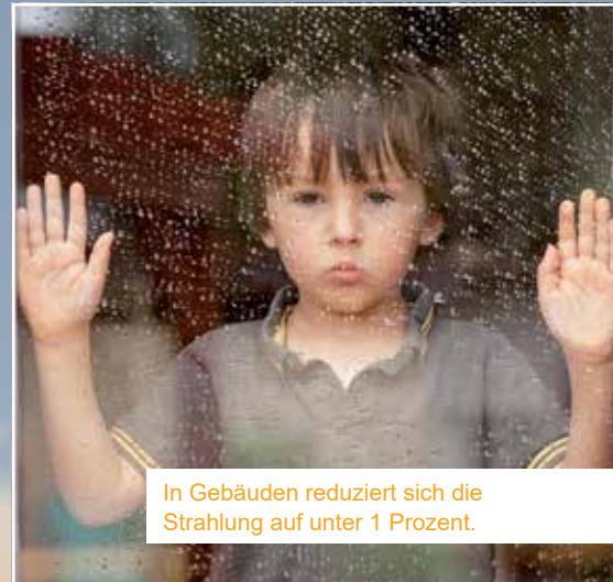
In Gebäuden reduziert sich die Strahlung auf unter 1 Prozent.

Vor allem nach dem Durchzug radioaktiv kontaminierter Luft sind Reinlichkeit und Reinigungsarbeiten erforderlich – vom Dach bis zum Fußboden, vom Scheitel bis zur Sohle. Zentral ist die persönliche Bevorratung. Mindestens eine Woche lang sollte jeder Haushalt ohne Einkaufen auskommen. Das schließt neben Lebensmitteln auch Trinkwasser, Hygieneprodukte und Medikamente mit ein. Im absoluten Ernstfall sollte jeder Haushalt auch eine Woche ohne Strom auskommen. Einen umfangreichen Überblick über alle