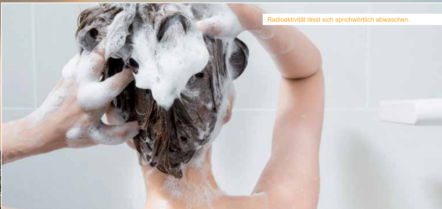
Radioaktivität lässt sich sprichwörtlich abwaschen.

Broschüre. Ebenfalls können Produkte im Webshop des Zivilschutzverbandes unter www.zivilschutzverband.at bestellt werden.