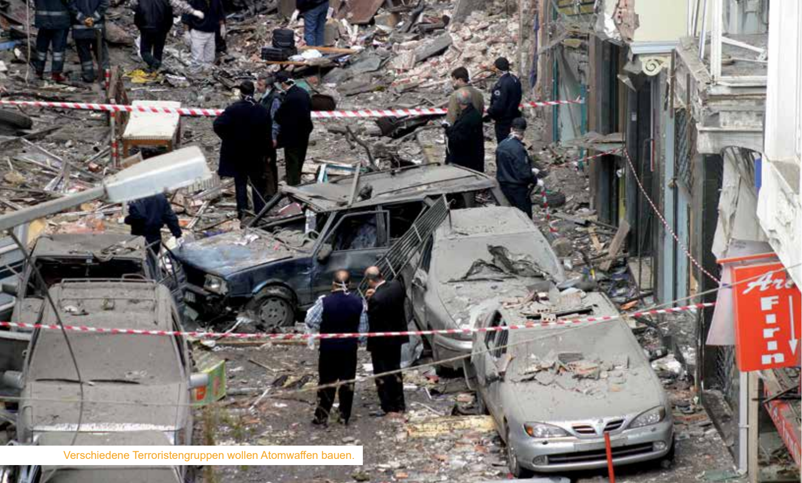
Verschiedene Terroristengruppen wollen Atomwaffen bauen.